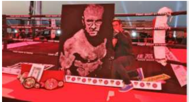
Un artiste qui a du PUNCH

Le public en participant à la vente aux enchères ludique et familiale pourra s'offrir ou offrir des tableaux d'artistes niçois reconnus comme SAUVAIGO, COMBA, E FER, GOUTTIN